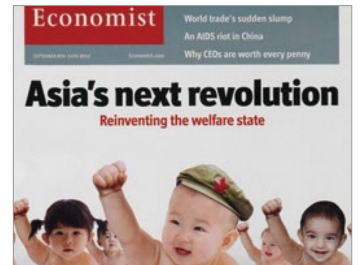
"The Economist." Economist , 8 Sept. 2012, p. [1]. The Economist Historical Archive