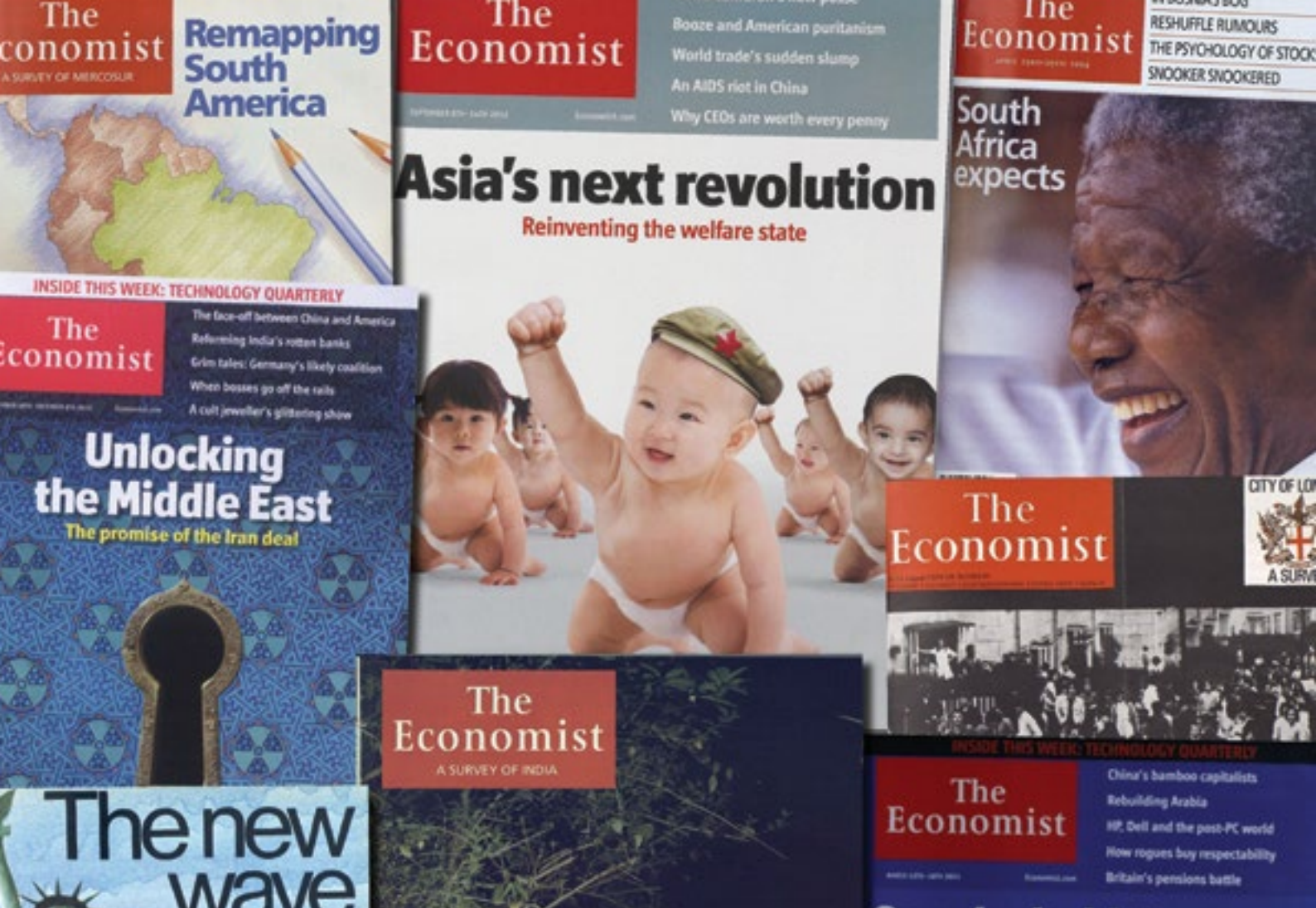
Various. Economist [London, England]. The Economist Historical Archive