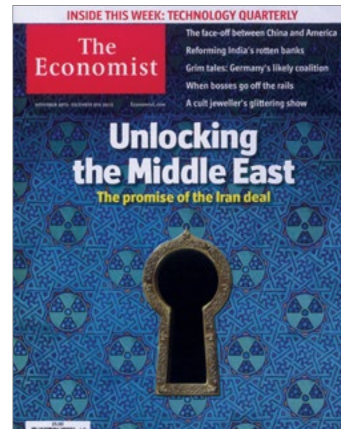
"The Economist." Economist , 30 Nov. 2013, p. [1]. The Economist Historical Archive